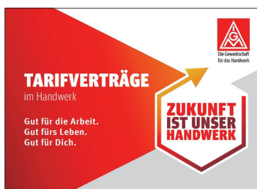
Kurz, knapp und anschaulich! Broschüre im Hosentaschenformat

Tarifverträge sorgen für Klarheit, Sicherheit und Gerechtigkeit. Speziell für Beschäftigte im Handwerk ist nun eine Broschüre im Hosentaschenformat erschienen, die noch einmal eindrucksvoll darstellt, wie wichtig Tarifverträge sind. Denn sie regeln entscheidende Aspekte unserer Arbeit und sorgen damit für ein besseres Leben. Unter dem Titel „Tarifverträge im Handwerk – Gut für die Arbeit. Gut fürs Leben. Gut für Dich“, werden Leserinnen und Leser in kurzen Kapiteln an das Thema Tarifverträge herangeführt: